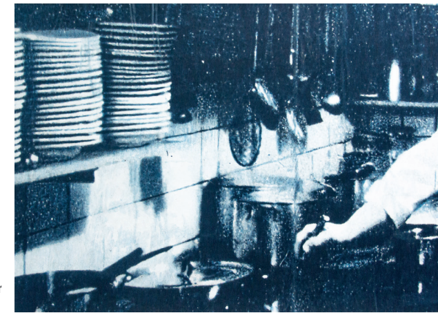
Othmar Eder Cucina