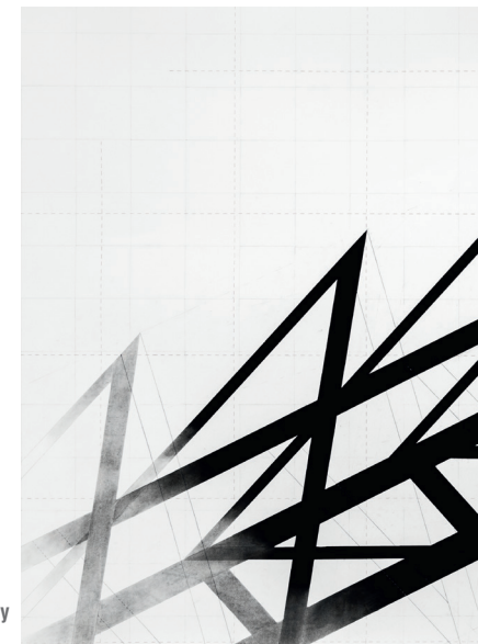
Cath Brophy Pylon I