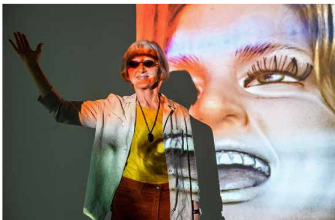
Das Eintauchen in die Wirklichkeit als teilweises Verschwinden in deren bildhafter Darstellung.