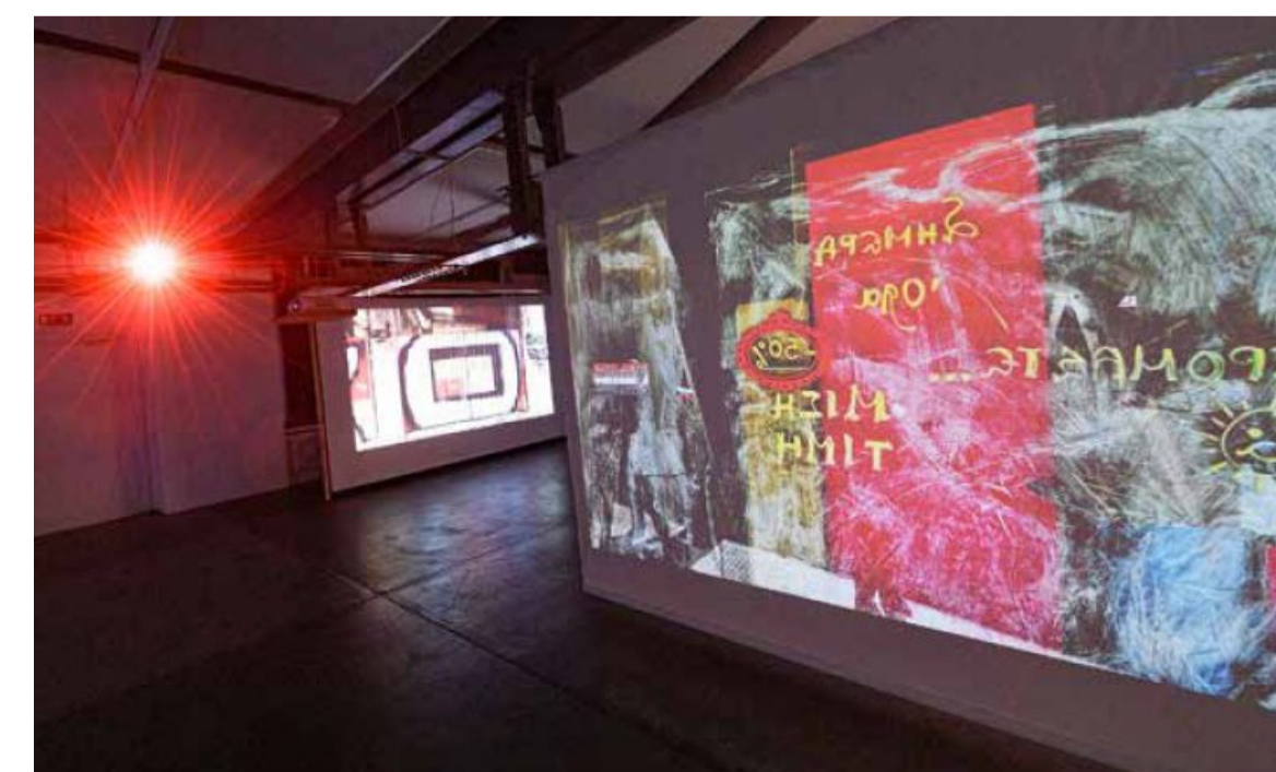
Künstlern wurden die Schaufenster oft in der Funktion von spiegelnden Leinwänden mit Reizen aufgeladen.