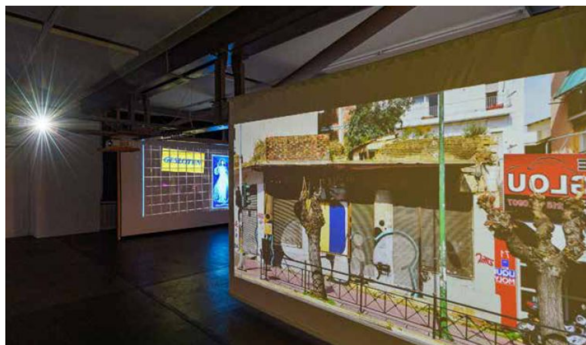
Dank wechselnder Projektionen versetzt einen die Ausstellung in Passagen, wie man sie in jeder Stadt findet. Von den