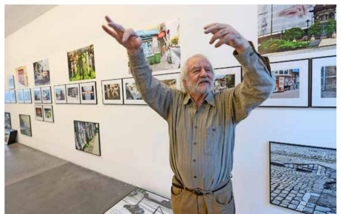
Der Künstler als temperamentvoller Erzähler und Vermittler von neu gewonnenen Erkenntnissen.